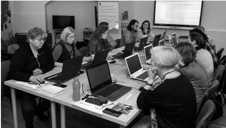
Muziejininkų mokymai dirbti su LIMIS.

ekspонатų apskaitai naudojamus dokumentus ir ataskaitas, viešino ekspонатų duomenis, papildė bendramuziejinius ir muziejinius klasifikatorius ir kt. Praktinę dalį vedė LM ISC LIMIS Metodinio skyriaus vedėja Dalia Sirgedaitė.