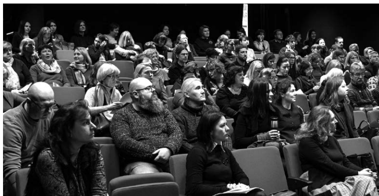
Seminaro „Kūrinių autorių turtinių teisių perėmimo aktualijos“ dalyviai.

Seminare pristatytos temos: kūrinių autorių turtinės bei neturtinės teisės ir jų apsauga, autorių teisių objektai, autorių teisės nesaugomi objektai, autorių teisių subjektai, autorių teisių problematika, autorių turtinių teisių turėjimo faktą patvirtinantys dokumentai, kūrinių autorių turtinių teisių perdavimo ir suteikimo naudotis dokumentai (sutartys, testamentai, kt.), jų sudarymo principai, dažniausiai daromos klaidos rengiant šiuos dokumentus ir kaip juose turėtų būti detalizuotos šių kūrinių pakartotinio panaudojimo galimybės ir sąlygos.