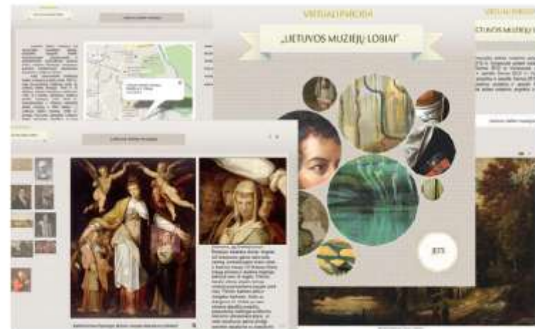
„Lietuvos muziejų lobiai“ naudojimosi instrukcija