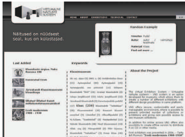
Estijos Respublikos virtualių parodų sistema www.virtuaalmuseum.ee